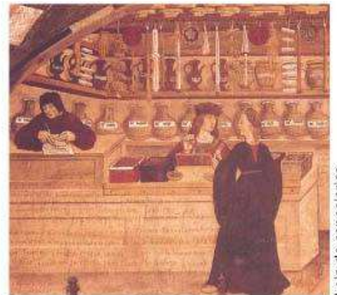
Loja de especiarias