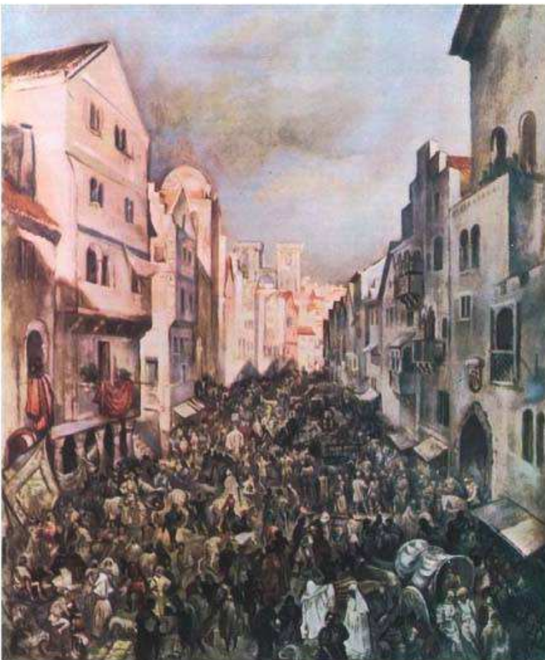
Rua Nova dos Ferrões no século XVI, pintura de Martins Barata